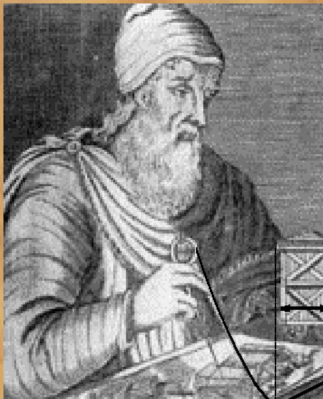
ΑΡΧΙΜΗΔΗΣ Ο ΣΥΡΑΚΟΥΣΙΟΣ